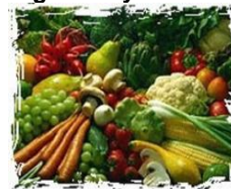
Vegetales y verduras

El costo calórico de los vegetales y verduras se abarató en B/.1.23 o 4.8%. Respecto al mes anterior, con excepción del correspondiente al ajo, todos los demás costos disminuyeron. Destacan, como las más importantes, las rebajas en la lechuga (11.7%), plátano (7.6%), papas (3.6%), yuca (3.5%) y ñame (3.3%). El índice de precios al consumidor, muestra una baja en las legumbres y verduras frescas de 3.8%.