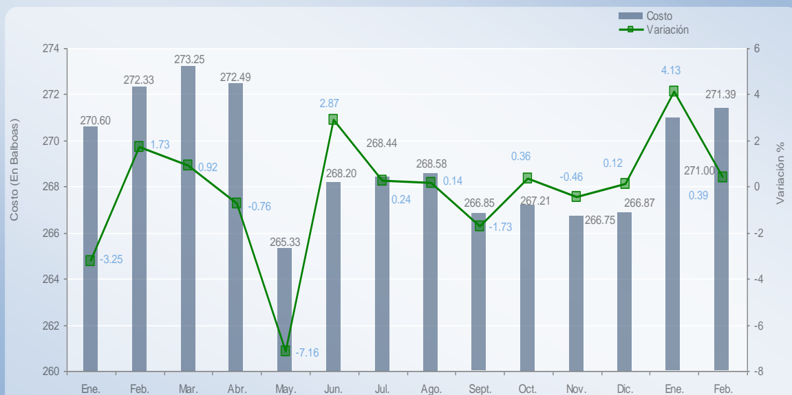
Gráfica N°1: Costo mensual de la canasta básica familiar de alimentos en los distritos de Panamá y San Miguelito. Año 2009 y enero a febrero 2010.