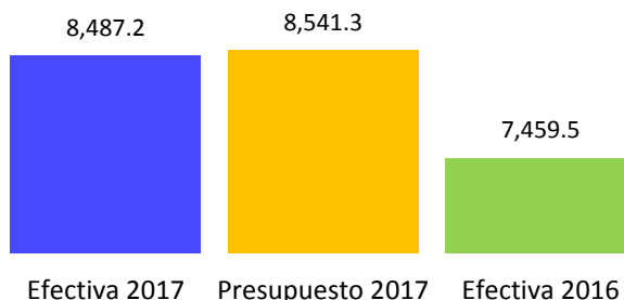
Gráfica 1.1 Comparativo Ingresos Corrientes, Año 2017; (En millones de balboas)