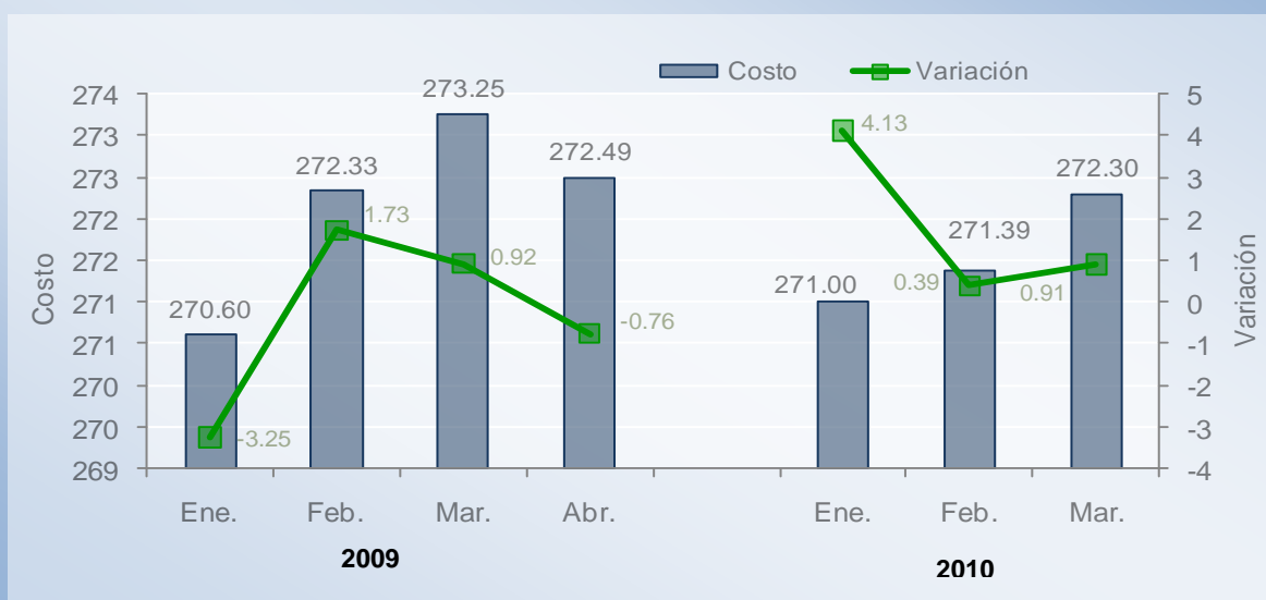
Gráfica N°1: Costo mensual de la canasta básica familiar de alimentos en los distritos de Panamá y San Miguelito. Enero a abril de 2009 y enero a marzo de 2010. (En balboas)

Fuente: Ministerio de Economía y Finanzas.